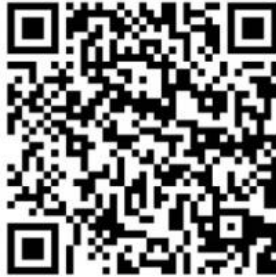
QR Code แบบสำรวจการใช้รถ

๕.๔.๒.๑ มาตรการด้านการควบคุมยานพาหนะ อำเภอวังสามสีบ